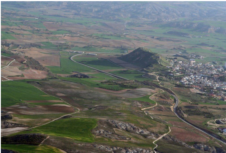
meditatie boven berg Huete.

Als jullie de mogelijkheid hebben om tijdens jullie verplaatsingen een meditatie sessie te doen dan kunnen wij jullie zo meer details geven om de exacte plek te zoeken. Anders zullen wij trachten een beeld te geven van de plaats waar jullie moeten zijn voor het ophalen van de gegevens die er duizenden jaren geleden werden opgeslagen. Documenteer je eerst over de stad en haar omgeving en we zullen tekenen geven op jullie C6 en C7 en druk uitoefenen op jullie hoofden om de juiste plaats te vinden. Daar gaan jullie in meditatie en wanneer de meditatie voltooid is zullen al de nodige gegevens in jullie opgeslagen zijn.