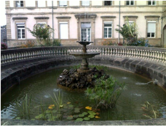
Fontein achter gemeentehuis Tulle.