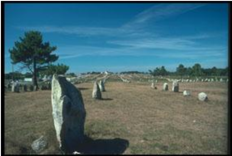
Carnac megalitische site.

Wanneer jullie terugkeren uit Duitsland en jullie in de regio van Carnac zullen zijn, gaan jullie een Lichtanker scheppen rond de "Grand Menhir de Mesnil van 6m hoogte" met de mensen die daar beschikbaar zijn. Jullie gaan dit Lichtanker scheppen door de Menhir in het midden van het anker te plaatsen. Je kunt het anker op de hoogte van de Menhir scheppen of lager, het heeft het geen belang. Wij plaatsen vooral dat anker daar want het is een toeristische plaats waar veel mensen voorbij komen die deze Menhir aanraken. De zielen die er zijn sinds honderden duizenden jaren zullen langs dit Lichtanker kunnen bevrijd worden omdat het Licht ervan hen zal aantrekken.