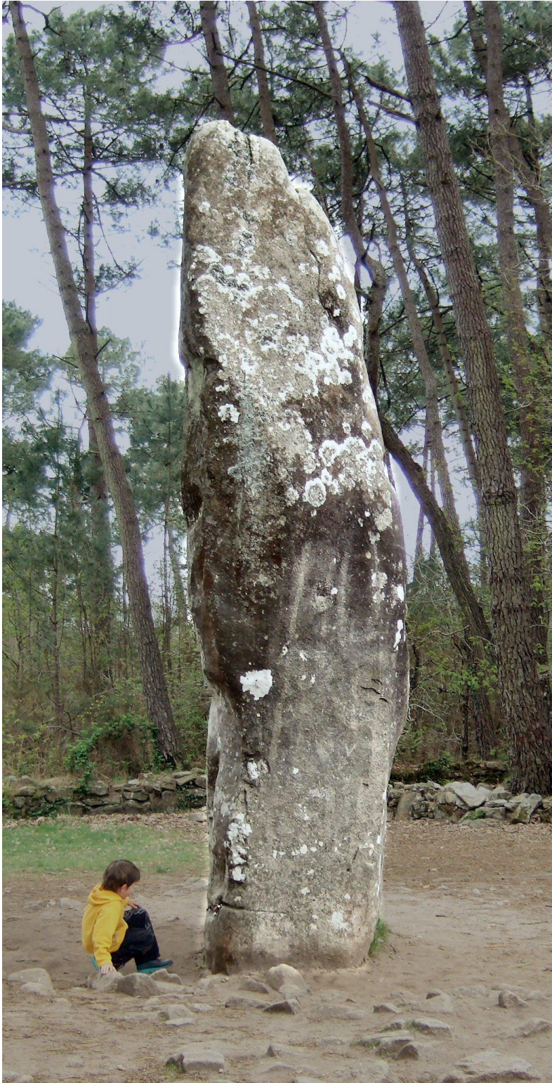
Grote Mehnir van 6m.

U mag ook een Lichtanker plaatsen bij de persoon waar jullie gaan logeren waar hij zich het beste voelt om er rond te mediteren als hij dat wenst.